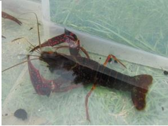
25/08, rode Amerikaanse rivierkreeft , Oe Thantstraat Tanthof west, Aukje Gjaltema.