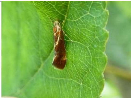
25/08, Italiaanse kaneelsikkelmot , op Hodenpijl, Willemein.