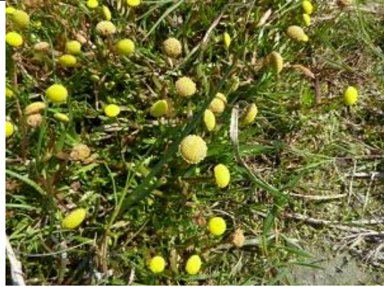
03/09, goudknopje , Kraaiennest, Cor Nonhof.

3 september, nieuws van het Kraaiennest Het Kraaiennest is opnieuw ingericht mede met onze inspanning. Met name de heringerichte plas is een groot succes. Vrijdag waren daar: grutto, tureluur, lepelaar, kluut, meerkoet en purperreiger . Op de nieuwe slikken groeit massaal goudknopje , een pionier van slikken en schorren. Ook is er nieuwe boomaanplant en een akker voor zaden als voer voor zaadeters. Cor Nonhof.