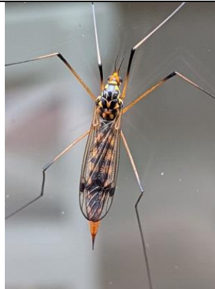
28/08, Nephrotoma analis , Den Hoorn, Willemein.