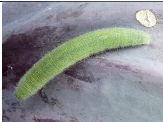
25/08, klein koolwitjesrups op rode kool Op Hodenpijl, Willemein.