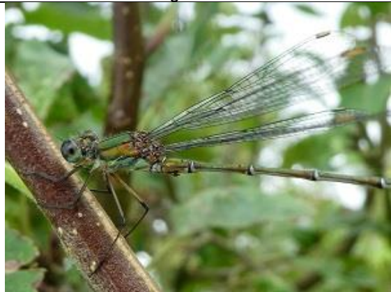
25/08, houtpantserjuffer , Schipluiden Willemein.