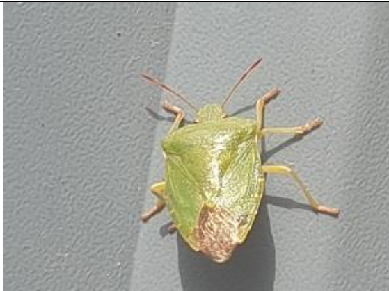
29/08, groene schildwants , Witmolen Delfgauw, Johan Molenbroek.