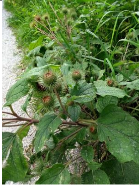
01/09, gewone klit , Groenzoom Pijnacker, Lia Claus.