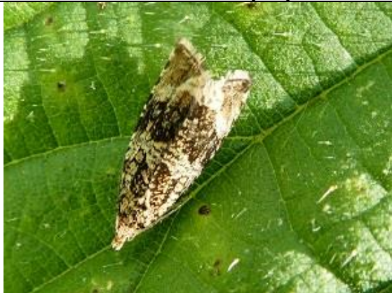
25/08, brandnetelbladroller , Op Hodenpijl Willemein.