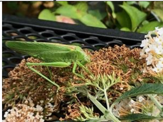
31/08, grote groene sabelsprinkhaan , in mijn postzegeltuin, Elly.