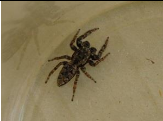
01/09, schorsmarpissa , Syriëstraat, Aukje Gjaltema.