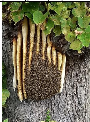
01/09, bijen met honingraten , Westgaag, Els van Vliet.