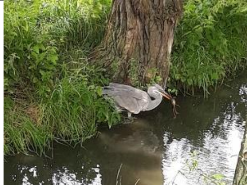
30/08, reiger met kikker Vietnampad, Aart Struijk.