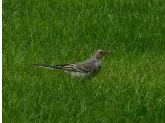
30/08, witte kwikstaart , Jorispad, Naaldwijk, Trudie van Berg.