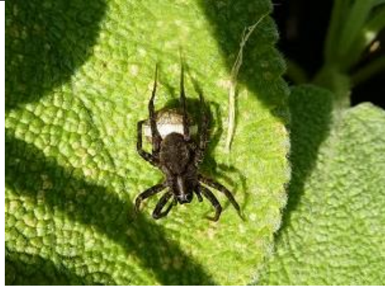
25/08, wolfspin met eipakket, Op Hodenpijl Willemein.