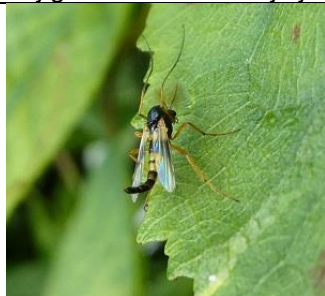
25/08, grote sponsmug op Hodenpijl Willemein.

Wij gaan er vanuit dat je je waarneming zelf meldt via www.waarneming.nl