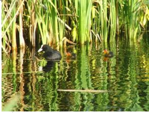
30/08, meerkoet nest, Abtswoudse bos, Aukje Gjaltema.