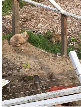
17/12, een wild konijn kijkt naar tamme konijnen , tuin tinyhuis, Vulcanusweg Delft, Denise Enthoven,