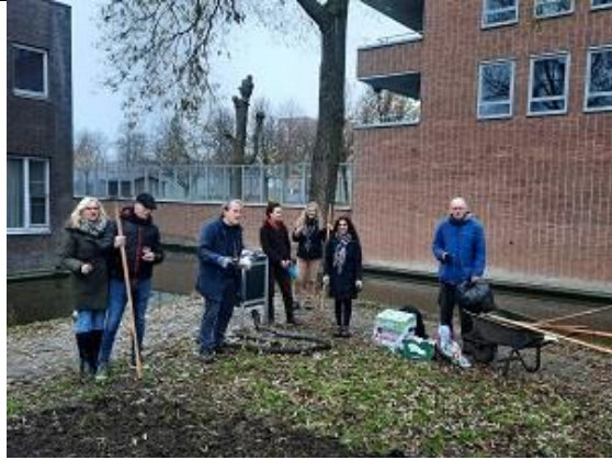
18/12, bollen planten in Ypenburg, foto genomen door een langslappende voorbijganger.