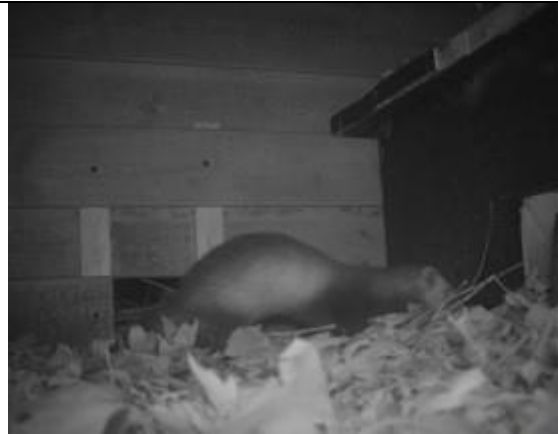
10/10, bunzing , Buitenhof, Fred van der Knaap