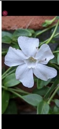
13/12, maagdenpalmbloem , Den Hoorn, Willemein.