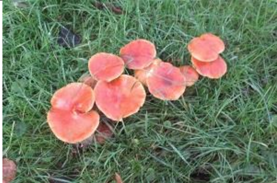
11/12, oranjerode stropharia in de berm Bergse Bos, Jos van Koppen.