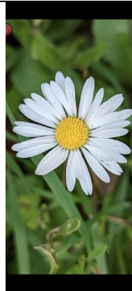
13/12, madeliefje , Den Hoorn, Willemein.