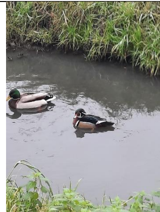
17/12, Carolina eend

18 december 10:00 – ca 12:00 uur Studiegroep Lichenen (voorheen Korstmossen)