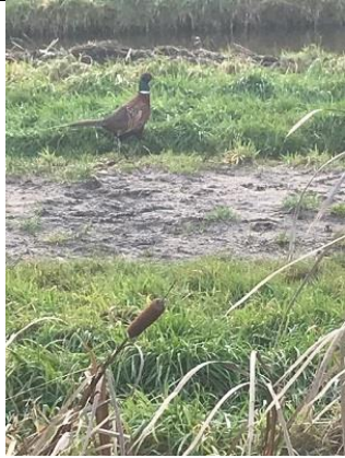
11/12, fazanhaan , Kerkpolder, Bruun vd Steuijt.