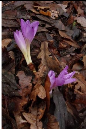
17,12, herfstcrocussen , De Tempel, Freek Boon.