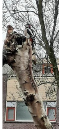
13/12, grote bonte specht , Otterlaan Delft, H. Merkus.