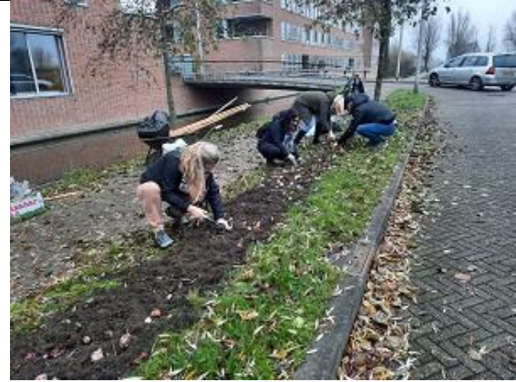
18/12, bollen planten in Ypenburg.