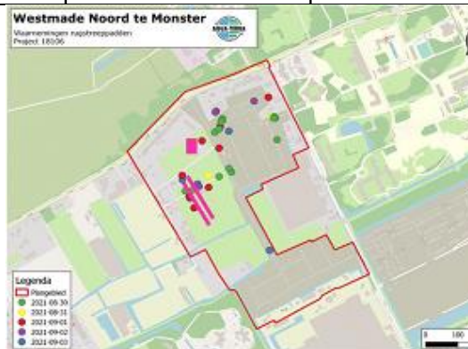
waarnemingen rugstreepadden Westmade noord.

Als je niet langer op de hoogte gehouden wilt worden stuur een email aan: