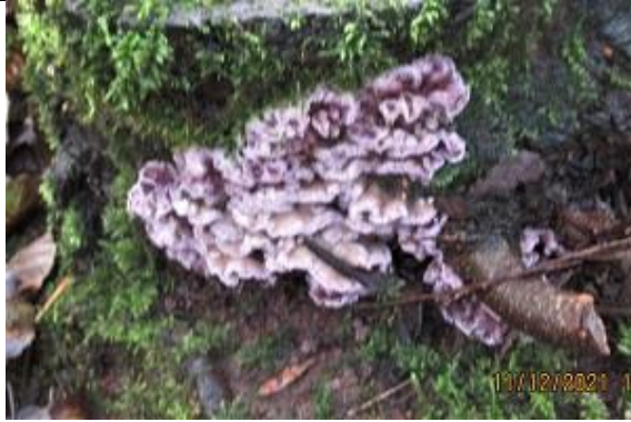
11/12, paarse korstzwam op boomstronk Bergse Bos, Jos van Koppen.