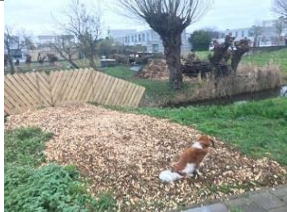
15/12, en nieuw hek op boomgaard Slotgaard.

17 december 9:00 tot 11:00 uur. fietstocht Hazen en konijnen in de polder